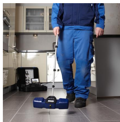
视频镜头走向和位置探测