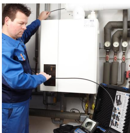
新风和供暖管道内部积尘排查