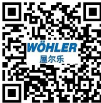
Wöhler (屋尔乐) 微信商城