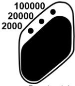
图 4: 『量程选择』键