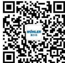
Wöhler (屋尔乐) 微信公众号