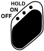
图 3: 『开关/冻结』键