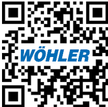
Wöhler (屋尔乐) 中文网站

Wöhler(中国)技术服务中心 上海市闵行区春申路 2525 号 117-2 室 Tel.: +86 6487 0575 Fax: +86 6487 0573 info@woehler.com.cn www.woehler.com.cn