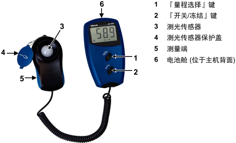
图 1: LX 300 结构和部件